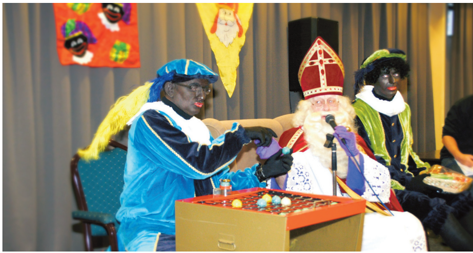
Sinterklaas verzorgt de bingo tijdens de ouderenmiddag.

TILBURG - Het Centraal Sint Nicolaas Comité is de stichting, die al sinds jaar en dag verantwoordelijk is voor het Sinterklaasfeest in Tilburg. Maar het Sint Nicolaas Comité is meer dan alleen de intocht. Dit blijkt ook uit de kernwaarden van het Comité "iedereen telt mee" en "behoud van Sinterklaas traditie", en de wijze waarop hieraan invulling wordt gegeven.