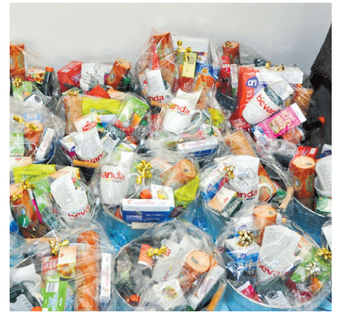
Zo'n 450 ouderen krijgen een mandje met luxe artikelen en hebbedingetjes en een gedicht.

Stuur uw oplossing voor dinsdag 1 november per e-mail naar het adres lezers@tilburgsekoerier.nl . De prijswinnaars ontvangen persoonlijk bericht van ons.